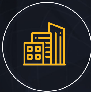
INMOBILIARIA Y DESARROLLADORAS