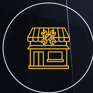
CONSTRUCCIÓN Y OPERACIÓN LOGÍSTICA FERRETERÍA