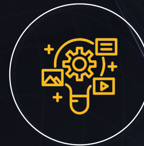
MEDIOS Y AGENCIAS DE MARKETING